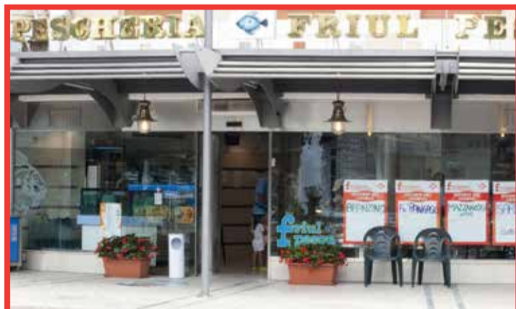
Via dei Pini, 2 Lignano Pineta Tel. 0431428646 Fax 0431428646