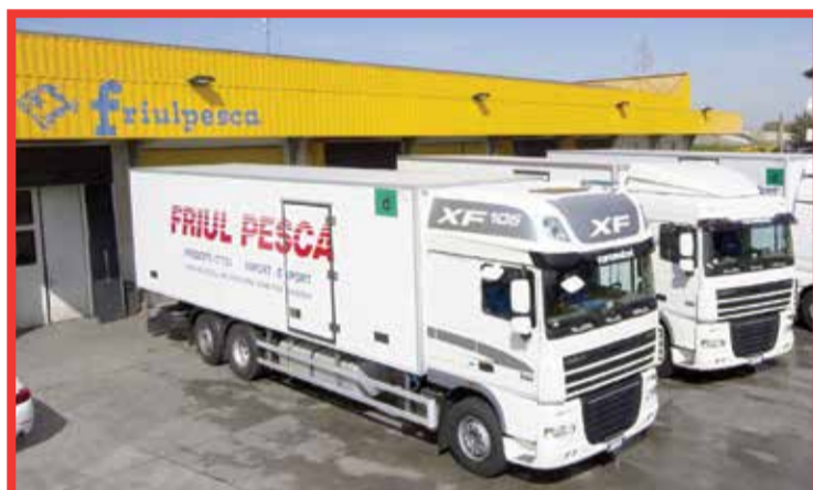
Via Marano, 96 Carlino Tel. +39043167921 Fax +39043167997