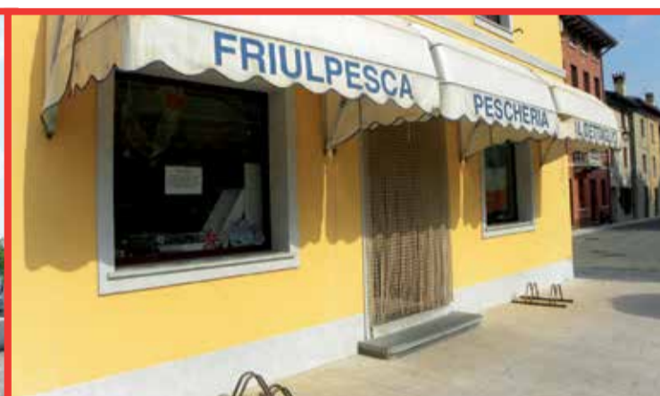
Via Roma, 22 Marano Lagunare (UD) Tel. 043167969