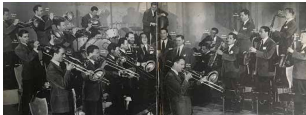
La celebre orchestra del trombettista e direttore Glenn Miller in un'immagine fotografica colta da un long plaining del 1960

Atteso ricordo di Glenn Miller il 18 ottobre nel nostro prestigioso teatro