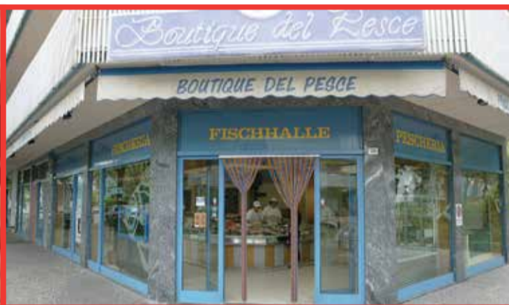
Via Latisana 99/101, Lignano Sabbiadoro Tel. 0431-73703 Fax 0431-73775 pescheria.lignano@friulpesca.it