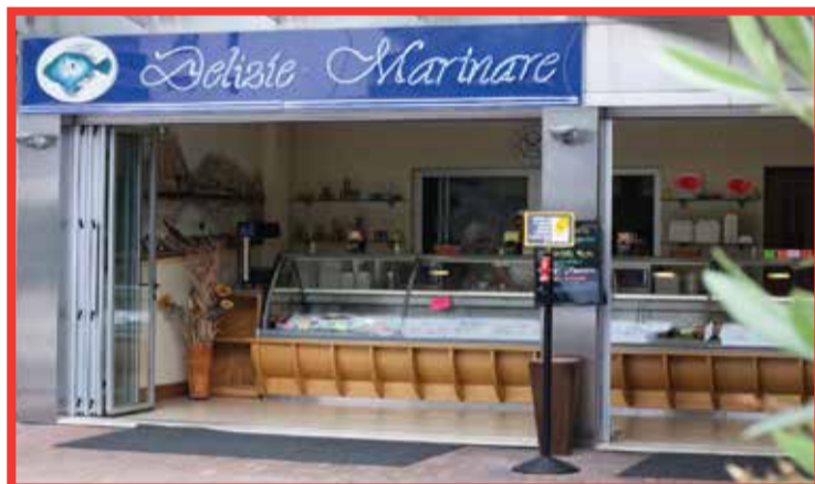
Gastronomia Delizie Marinare Via Latisana, 118 Lignano Sabbiadoro (UD) Tel. 0431724087