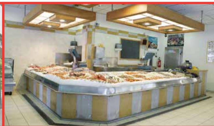
Piazza Fontana, 50 Bibione Tel. 043143255 Fax 0431446795 Pescheria.bibione@friulpesca.it