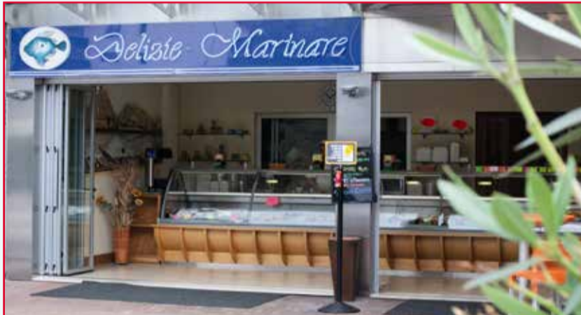
Gastronomia Delizie Marinare Via Latisana, 118 Lignano Sabbiadoro (UD) Tel. 0431724087