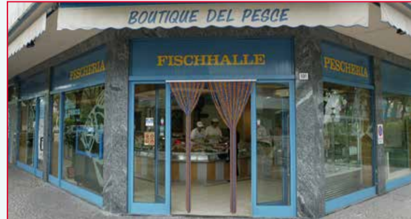
Via Latisana 99/101, Lignano Sabbiadoro Tel. 0431-73703 Fax 0431-73775 pescheria.lignano@friulpesca.it