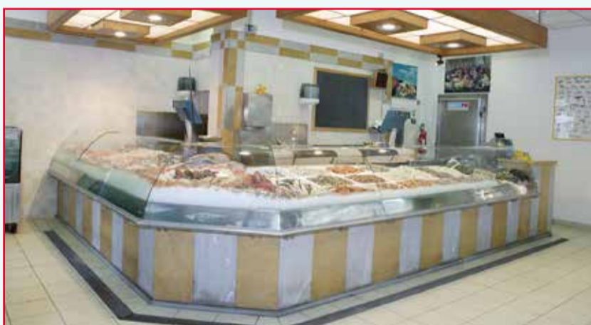
Piazza Fontana, 50 Bibione Tel. 043143255 Fax 0431446795 Pescheria.bibione@friulpesca.it