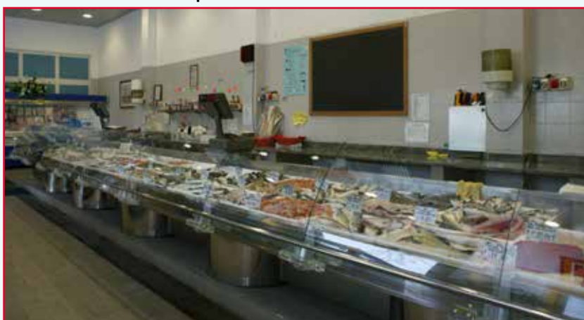
Via Percoto, 35 Latisana Tel. 0431521230 Fax 0431511662 Pescheria.latisana@friulpesca.it