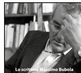
Lo scrittore Massimo Bubola