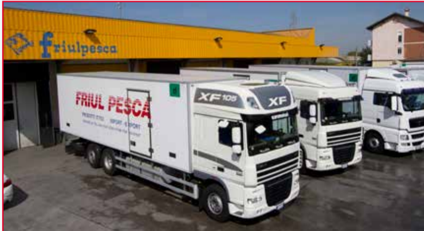
Via Marano, 96 Carlino Tel. +39043167921 Fax +39043167997