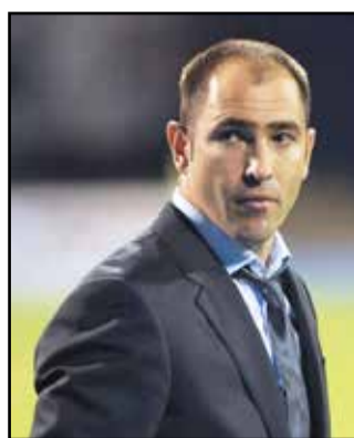
Il nuovo allenatore dell'Udinese Igor Tudor

la Spal, che difficilmente però si farà sorprendere tra le mura amiche da una Sampdoria senza più grossi stimoli, tutti team che attualmente le stanno al di sotto in classifica. Così, facendo i debiti scongiuri, la sciagurata formazione udinese riuscirebbe anche quest'anno, per la quarta volta di seguito, a "salvare la pelle" in extremis e soprattutto per demerito altrui più che per meriti propri, argomento di cui abbiamo scritto e parlato già lungamente nel corso di questo travagliato campionato. Salvezza certa, infine, raccogliendo col Bologna l'intera posta, cosa ahinoi non facilissima per i bianconeri di questi tempi, mettendosi così al riparo da ogni evenienza. Dopo le recenti 14 gare dell'Udinese senza suc-