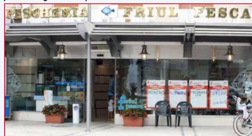
Via dei Pini, 2 Lignano Pineta Tel. 0431428646 Fax 0431428646