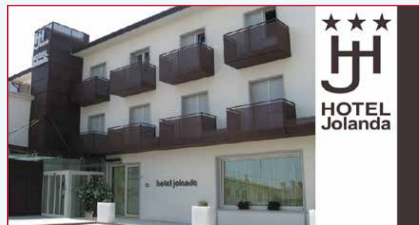
Via Udine 7/9 Marano Lagunare (UD) Tel. +390431640259 www.hotel-jolanda.it