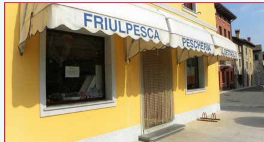
Via Roma, 22 Marano Lagunare (UD) Tel. 043167969